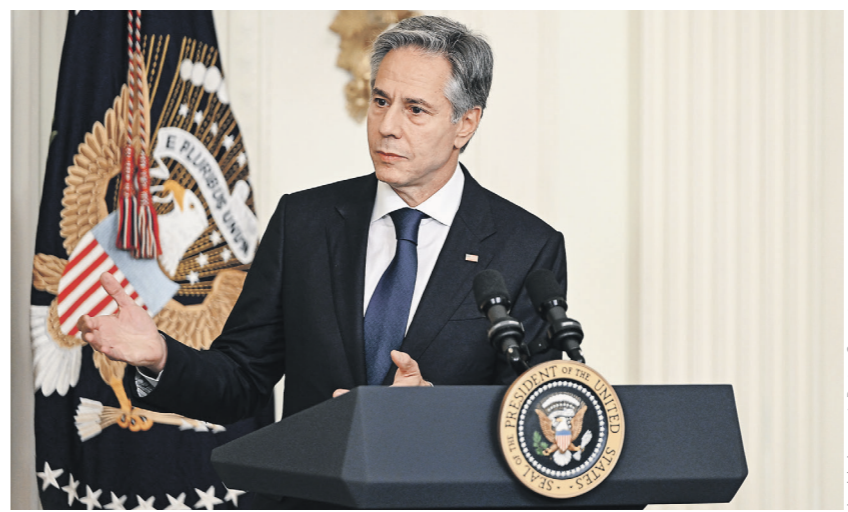
Anthony Blinken

При всём этом комплексе проблем и противоречий контакты между представителями США и Китая всё-таки существуют. И последние недели появились явные признаки активизации диалога. В мае в Вене прошла ранее неафишируемая двухдневная встреча главного китайского дипломата Ван И с советником по нацбезопасности США Джейком Салливаном. Её итоги обе стороны не конкретизировали, но дружно охарактеризовали как «откровенные, субстантивные и конструктивные». Чуть позднее, по сообщениям ряда СМИ, в Китае побывал директор ЦРУ Уильям Бёрнс.