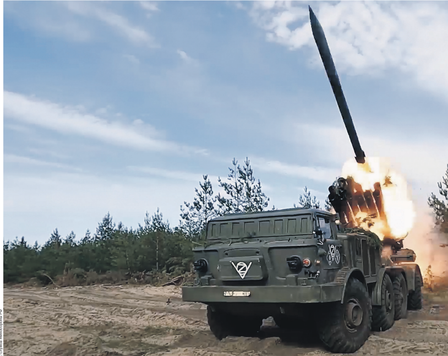
Плеск-Стрелы Минобороны РФ

На запорожском направлении ударами штурмовой авиации сорвана ата-