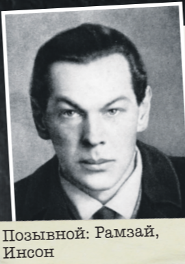
Позывной: Рамзай, Инсон

Рихард Зорге, дипломат, резидент советской разведки в Японии, Герой Советского Союза