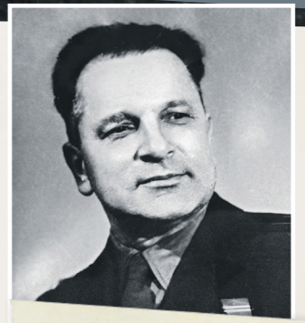
Позывной: майор Зорич

Александр Святоторов, полковник, советский разведчик