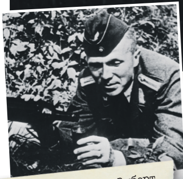
Николай Кузнецов, старший лейтенант 27.07.1911 — 9.03.1944 Советский разведчик действовал в тылу врага. В 1943 году в Ровно он захватил и ликвидировал немецкого генерала фон Ильгена.

Полвека классике — 11 августа исполняется 50 лет 12-серийному художественному телефильму Татьяны Лиозновой «Семнадцать мгновений весны». Он был снят по одноимённому роману Юлиана Семёнова. Первый показ собрал 70 млн зрителей. С тех пор Вячеслав Тихонов вместе с наградами получил звание всеююзного Штирлица, а картина стала культовой. «Известия» выяснили имена реальных спецантентов, ставших прототипами любимых героев шпионских фильмов о войне.