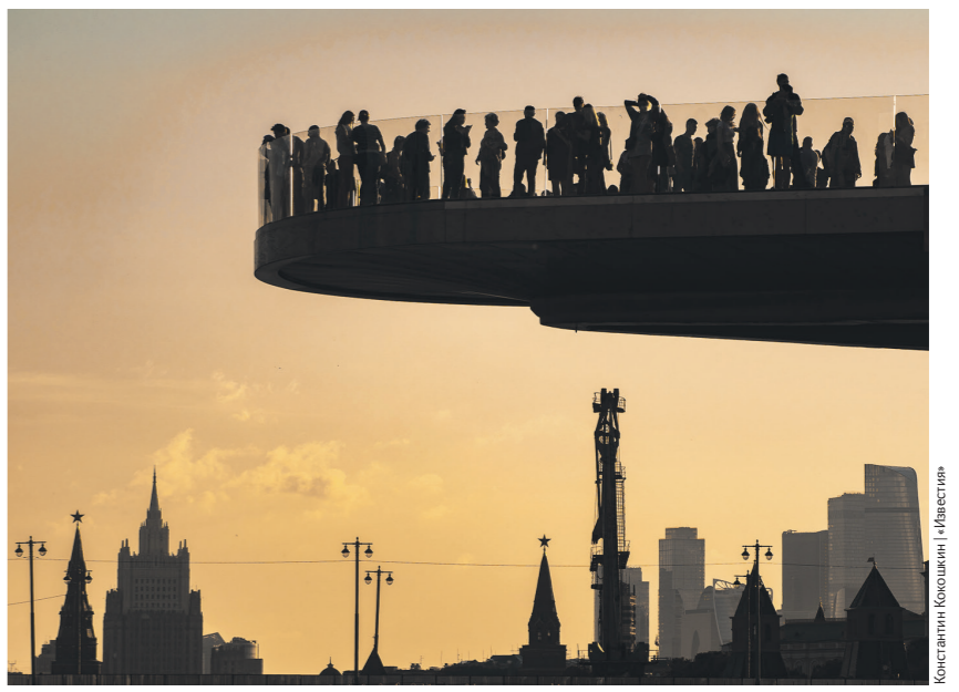
Ксения Козман / Иллюстрация

С уходом от «цифры» вероятность увеличения серого потока существенно вырастет. А это плохо ещё и потому, что китайские туристы традиционно тратят в нашей стране значительные суммы денег. Нужно возвращаться к цифровым технологиям, и как можно быстрее.