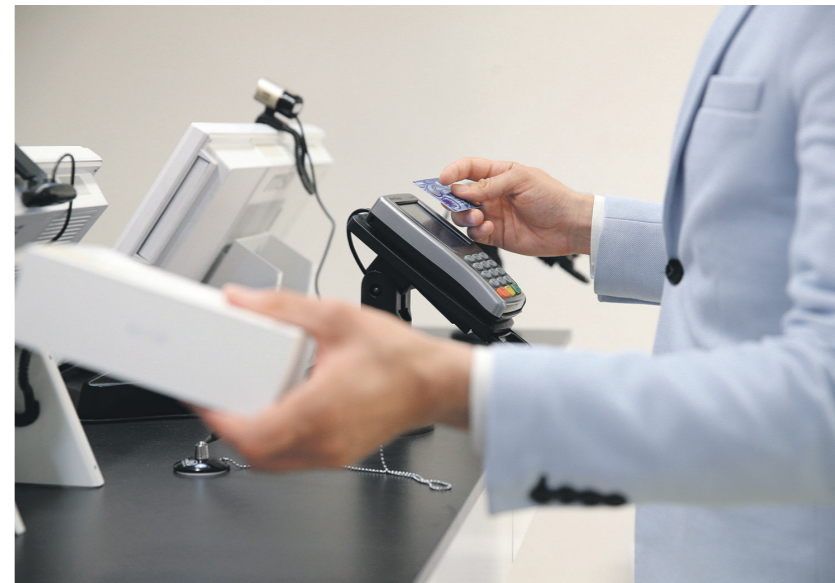
Павел Бородин / Иллюстрация