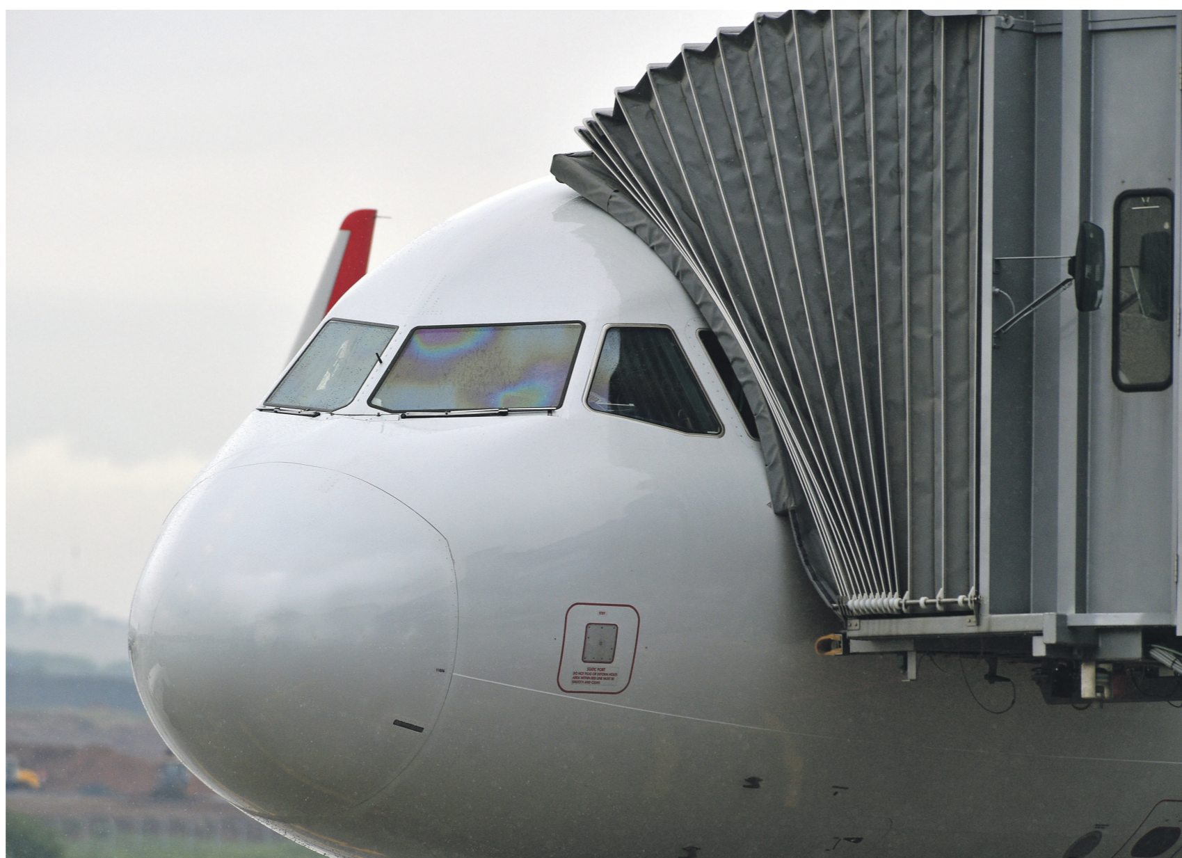
Цены авиабилетов в Калининградскую область выросли почти в три раза

На субсидирование полётов в Калининград (аэропорт Храброво) и продажу доступных билетов на 2023 год региону было выделено 356 млн рублей, напоминает общественник в письме. Эти средства были выбраны ещё в конце апреля, в результате чего стоимость перелёта в регион и обратно заметно выросла.