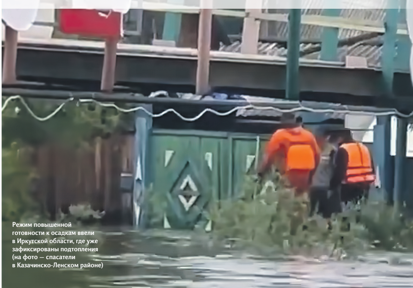
Режим повышенной готовности к осадкам ввели в Иркутской области, где уже зафиксированы подтопления (на фото — спасатели в Казачинско-Ленском районе)

На Дальний Восток обрушились экстремальные ливни