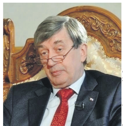
Пресс-служба посольства РФ в Румынии

Официальные румынские власти тщательно избегают упоминания об оказании какой-либо военной помощи Украине. Вместе с тем территория страны активно используется для транзита вооружений из третьих государств, что нередко можно наблюдать буквально невооружённым глазом. В СМИ циркулирует информация о расконсервации мощностей по производству боеприпасов как старых советских, так и натовских калибров. На северо-западе Румынии германский «Рейнметалл» уже создаёт ремонтное предприятие для восстанов-