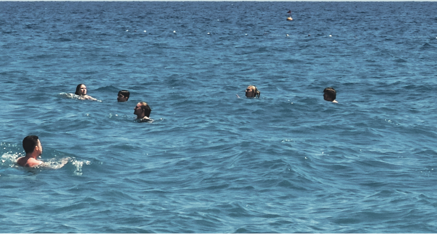
Дмитрий Коротаев / Иллюстрация

7 февраля в городе Ефремове Тульской области в результате взрыва в пятиэтажке погибли восемь человек, в том числе маленький ребёнок.