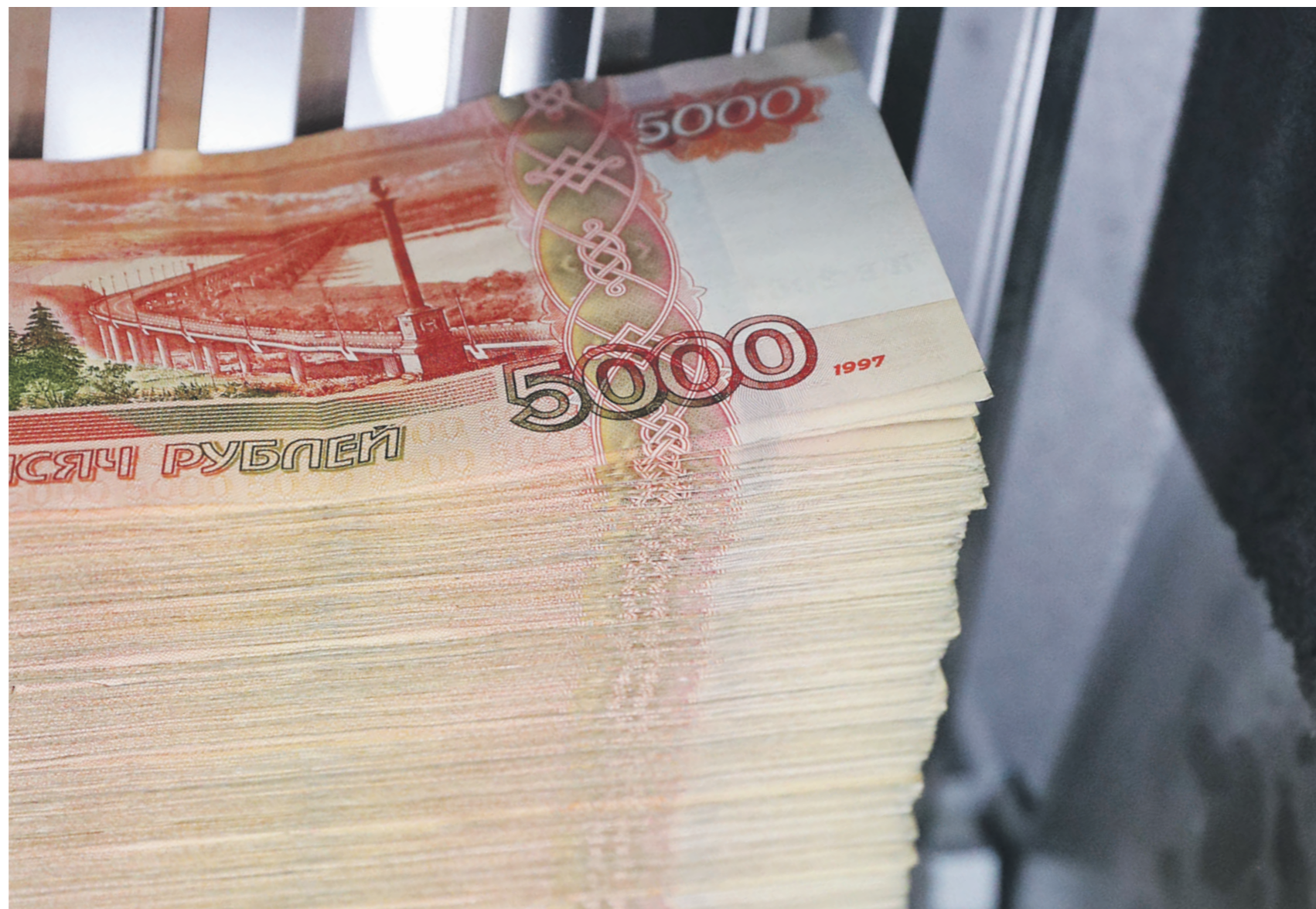
В 2023 году поступления в бюджет от приватизации достигли 12,1 млрд рублей