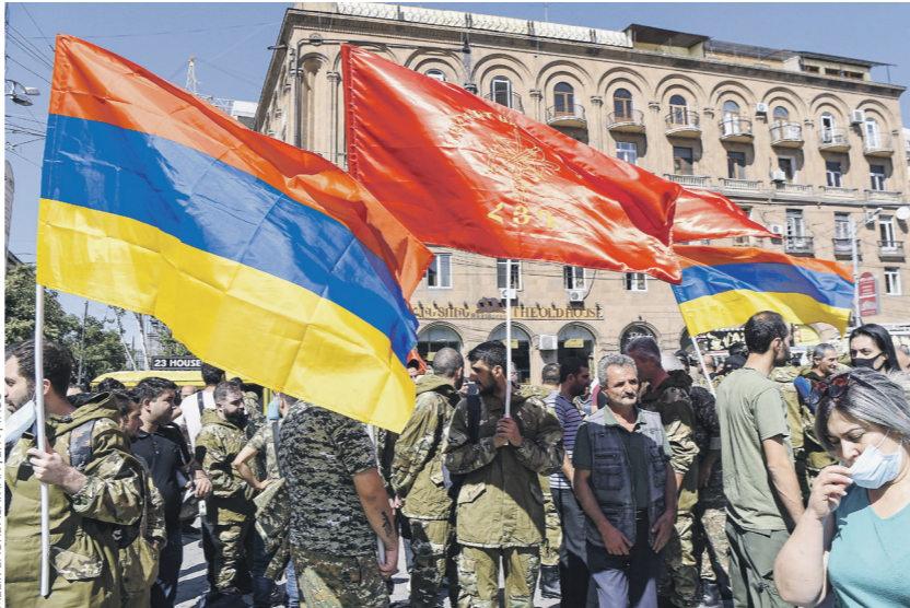
В Армении объявлены военное положение и всеобщая мобилизация