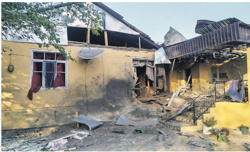
Разрушенный в результате обстрела жилой дом в Тертерском районе Азербайджана