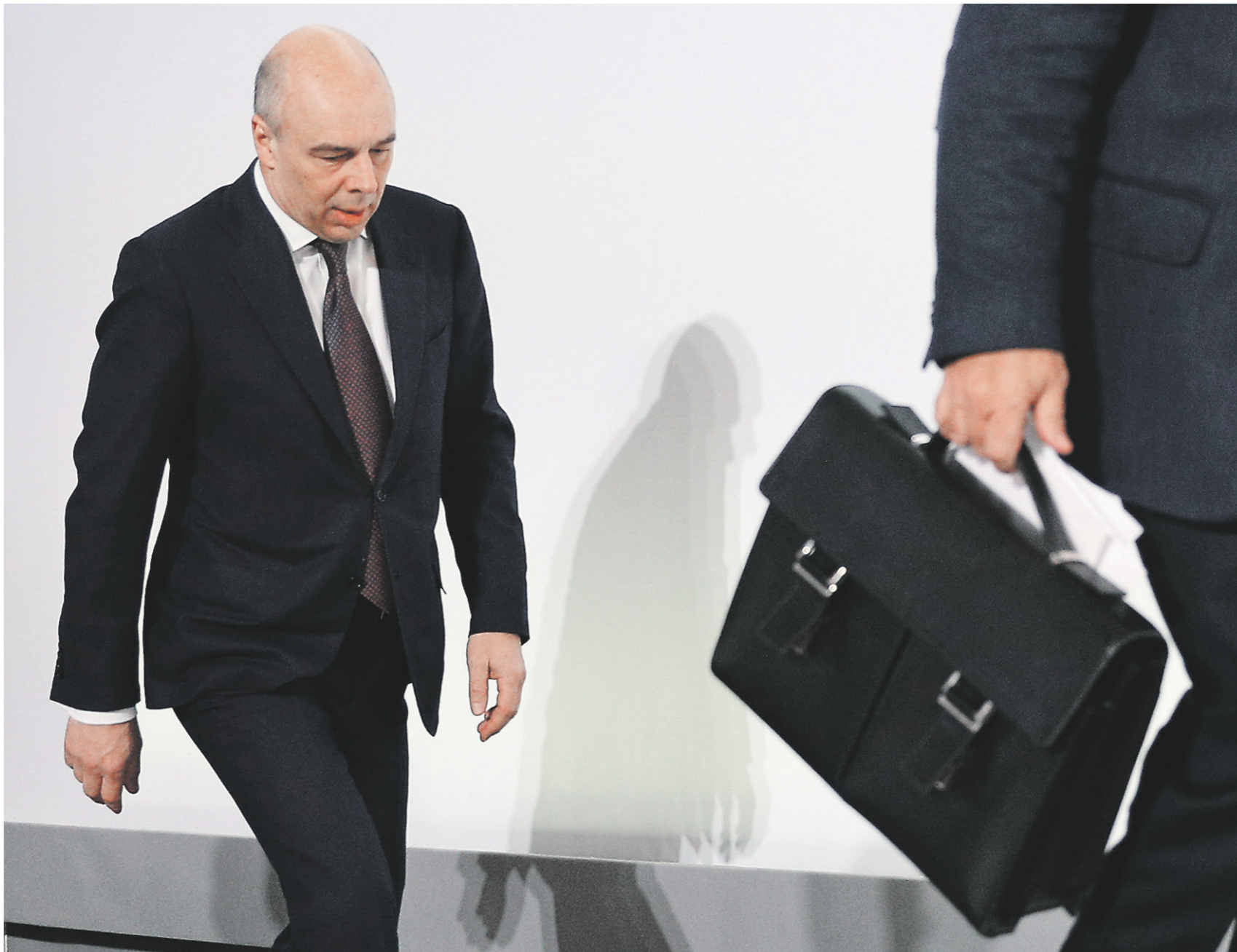
Перед ведомством Антона Силуанова поставлена задача сократить просроченные долги до 23% к 2023 году

Чтобы улучшить ситуацию с «проблемными» долгами, предлагается согласовать с иностранными государствами-заёмщиками условия урегулирования задолженности перед РФ с учётом интересов федерального бюджета, платёжеспособности стран-должников, а также международных обязательств нашей страны, уточняется в приложениях к проекту постановления правительства. 02 →