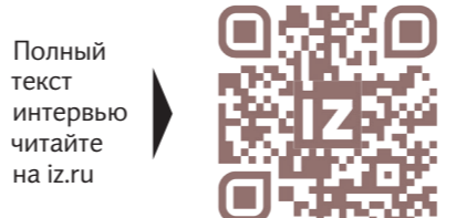
Полный текст интервью читайте на iz.ru

Нет. Кстати, это легенда, что «Яблоки на снегу» — афганская песня. Песня, собственно, ни о чём. Поэтому каждый её воспринимает как хочет.