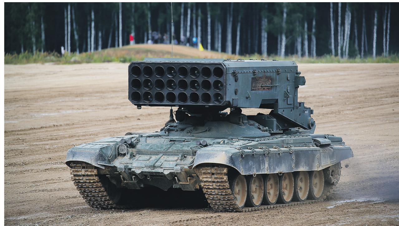
Дмитрий Корнеев / Иллюстрация

Внедрение автоматизированных систем управления позволяет увеличить огневую мощь артиллерии. По сообщениям Минобороны, на учениях регулярно отрабатываются удары по мишеням через считанные минуты после их обнаружения разведкой. Именно АСУ позволяет современным российским и зарубежным артистем поражать цели первыми залпами,