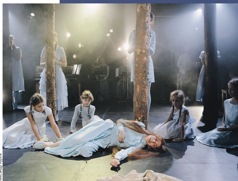
Опера «Мороз, Красный нос» рассматривается очень красиво