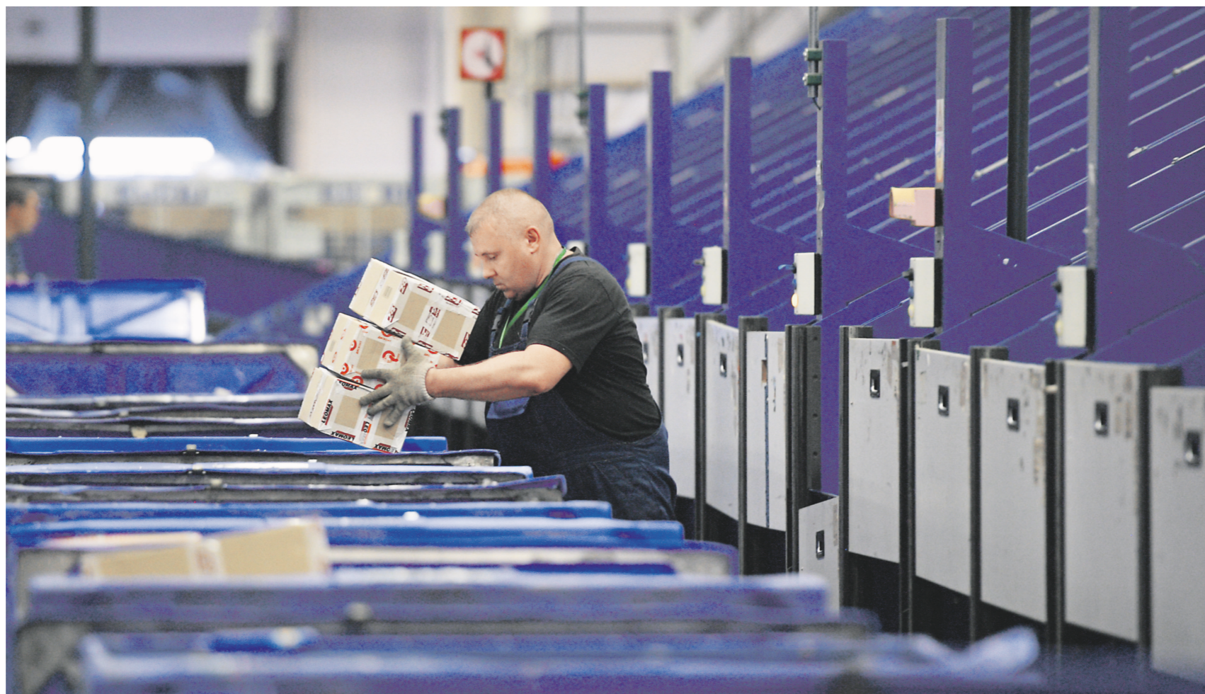
Сортировка посылок в логистическом почтовом центре «Внуково» (Московская область)

Резкое снижение порога беспошлинного ввоза может ударить по маломужским россиянам, заказывающим (зачастую в складчину) товары в зарубежных интернет-магазинах.