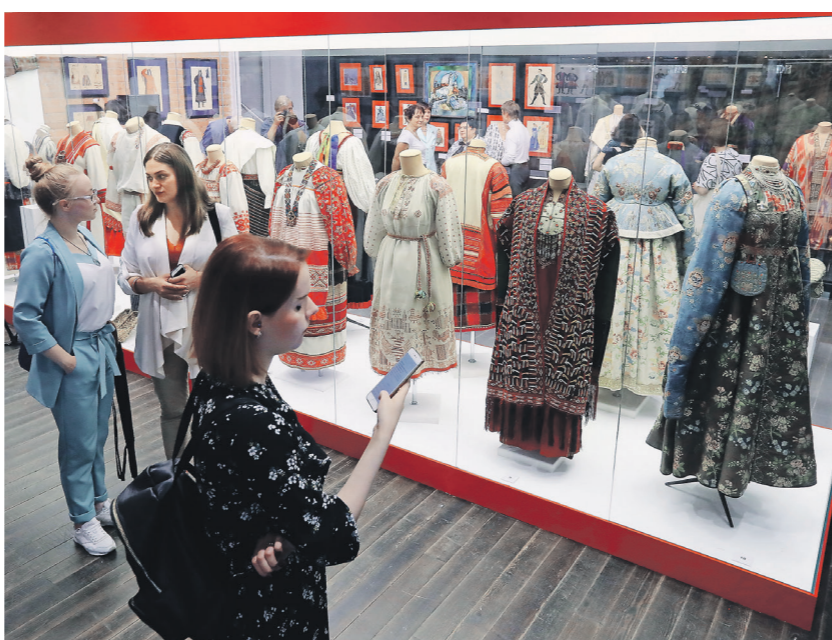
На выставке к 125-летию основания Театрального музея им. А.А. Бахрушина зрители увидели костюмы за всю историю отечественного сценического искусства

Немаловажный аспект — коммуникация между музеями. На нашем пор-