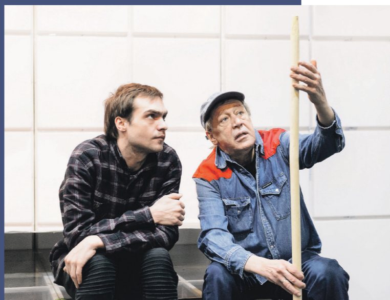
В театре назревают изменения. Появляются спектакли, которые нужно смотреть в 3D-очках, наушниках, своих адептов обретает мобильный театр. Что будет дальше?