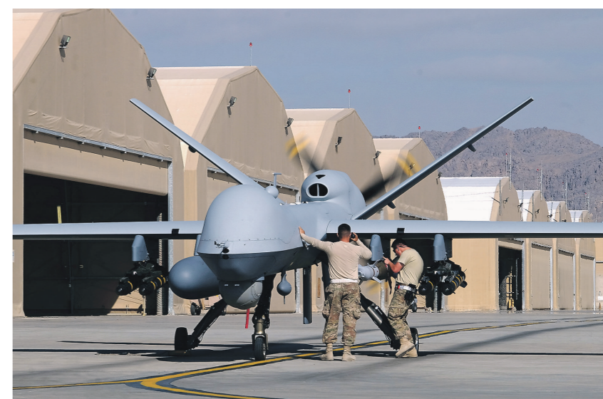
Россия зеркально ответит на размещение ракет США в Европе

При этом проблемы для стратегической стабильности ДРСМД и СНВ не ограничиваются. Международное сообщество никак не может прийти к консенсусу о заключении конвенции по борьбе с актами химического и биологического терроризма. Возможно, ответ кроется в том, что инициатива о создании подобного документа исходила от России, а это западным партнерам, мягко говоря, не нравится. Нет прогресса и по договору, предложенному совместно РФ и Китаем, о предотвращении размещения оружия в космическом пространстве, применения силы или угрозы силой в отношении космических объектов. Проект договора на столе есть, а переговоров по нему как не было, так и нет. А тем временем в США уже средства выделяются на создание космического сегмента ПРО и размещение на околоземной орбите ударных средств, отметил шеф российской дипломатии. Это значит, что американцы смогут зачистить космическое пространство от неугодных им объектов других стран, что создает риск открыть ящик Пандоры. Какотреагируют на речь Сергея Лаврова в Вашингтоне и других западных столицах, остается большим вопросом. Вряд ли США и их союзники резко поменяют курс с деградации стратегической стабильности на обеспечение международной безопасности. Так или иначе, Россия свое слово сказала, а если точнее — уже не раз повторила.