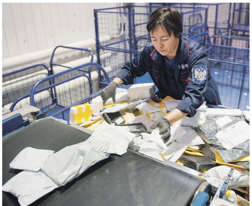
Сейчас доставка заказов из западных интернет-магазинов может занимать несколько недель