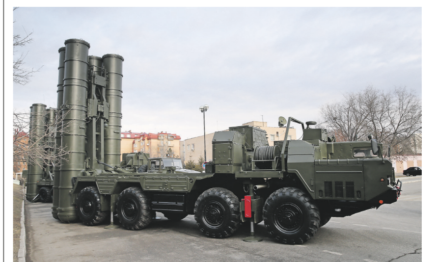
Главное оружие центра боевой подготовки — системы С-400 и истребители МиГ-29