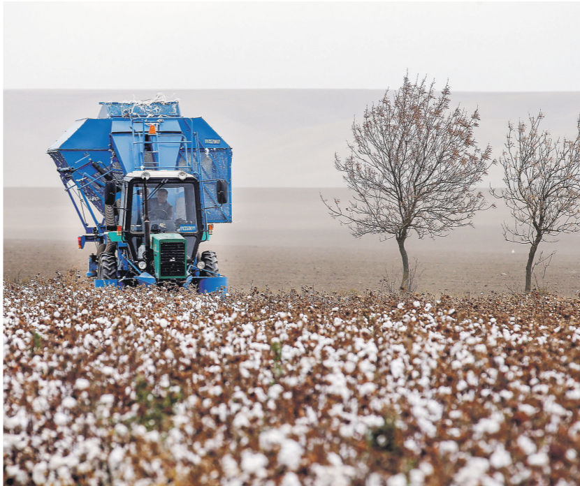
Основная проблема в сельском хозяйстве — дефицит льготных кредитов

В сфере туризма одна из основных проблем — банкротство туроператоров, рассказывал ранее «Известиям» один из федеральных чиновников. В частности, с этим должно бороться Минэкономразвития после того, как в его ведение перешел Ростуризм. Министерство сейчас готовит стратегию развития отрасли. В ведомстве конкретные меры не назвали.