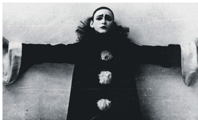
Исполнению Александра Вертинского были присущи магия и очарование, которые до сих пор никем не повторены

столько благосклонна, что прочтала не одно, а целых два. И это настоящее жемчужины альбома, потому что читает она их совершенно изумительно, и каждый раз, когда слушаю эти стихи в исполнении Анастасии Александровны, вижу за ней самого Вертинского.