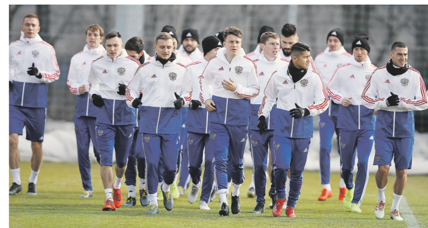
Сборная России начнет 2019 год матчем с командой Бельгии

Уже сегодня наша команда сыграет с бронзовым призером ЧМ-2018, занимающим первое место в текущем рейтинге ФИФА. Игра пройдет на самой большой арене страны — 67-тысячным стадионе имени короля Бодуэна в Брюсселе.