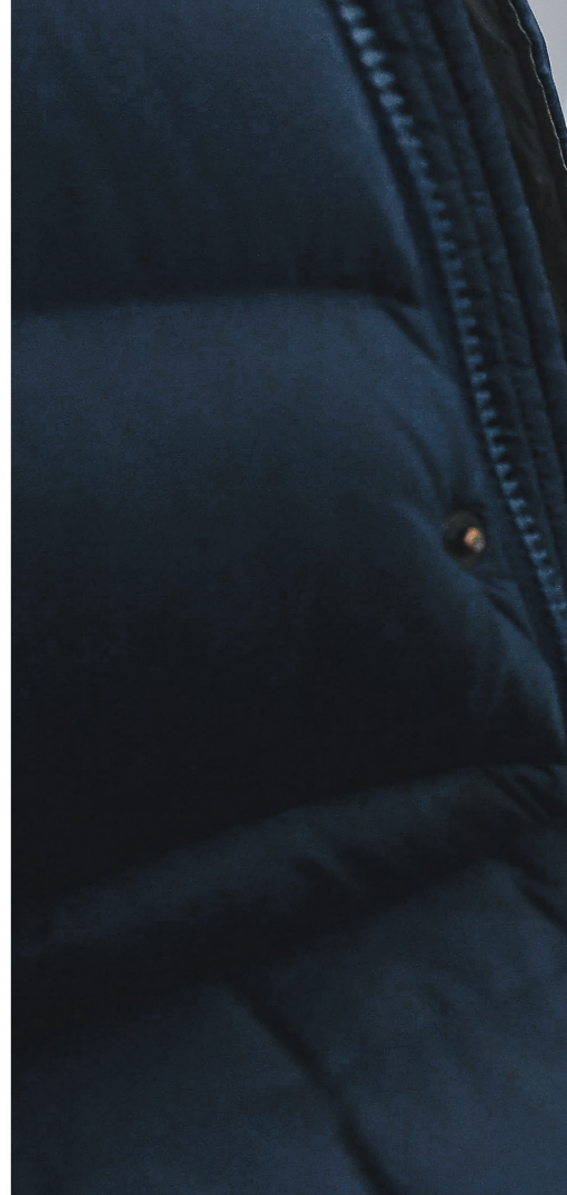
Некоторые банкоматы уже выдают и принимают

«В СМИ периодически сообщается о случаях отказа потребителям со стороны хозяйствующих субъектов под различными надуманными