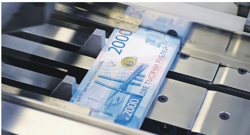
Дизайн новых банкнот был выбран по итогам общественного обсуждения