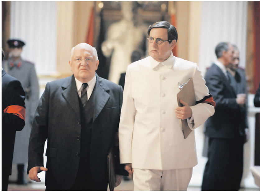
Создатели фильма не стремились к исторической точности образов

Министерство культуры приняло решение отозвать уже выданное прокатное удостоверение у британского фильма «Смерть Сталина».