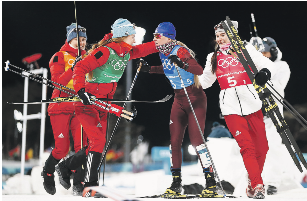
Женская сборная России впервые за 12 лет взяла медаль в эстафетной гонке

Российский лыжник Денис Спицов оказался в числе молодых спортсменов, которые успешно заменяют группу недопущенных до Олимпиады лидеров — Сергея Устюгова, Александра Легкова, Максима Вылегжанина и других. Вслед за Александром Большуновым 21-летний атлет доказал, что резервы российского лыжного спорта безграничны. Еще в первой гонке — скиатлоне Денис Спицов был близок