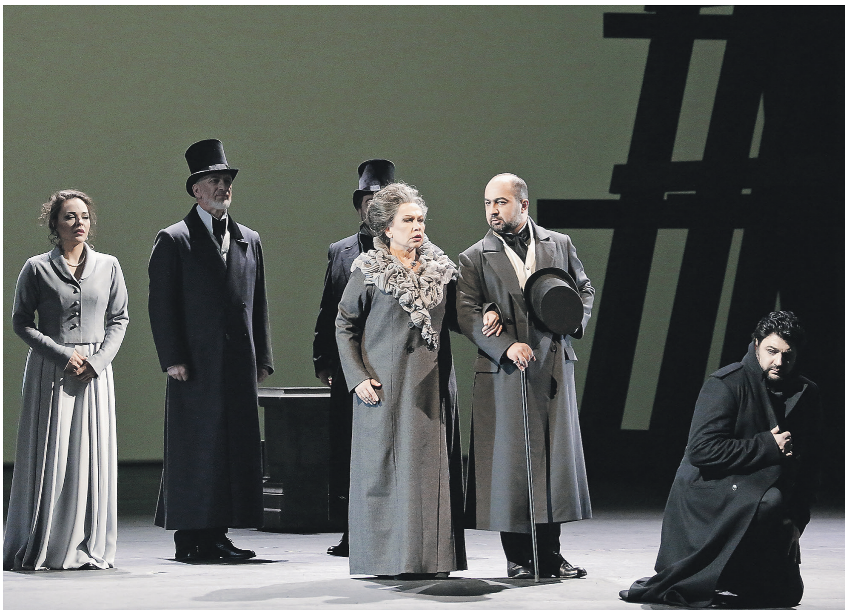
Сдержанная цветовая гамма спектакля призвана не отвлекать внимания от музыки Чайковского

В новом прочтении оперы Чайковского Большой театр сосредоточился на музыке