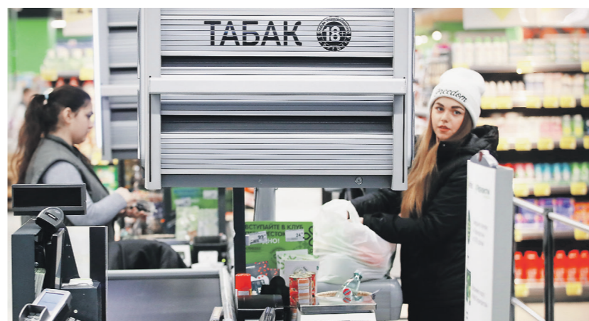
Штрафы за продажу табачных изделий детям могут вырасти в разы