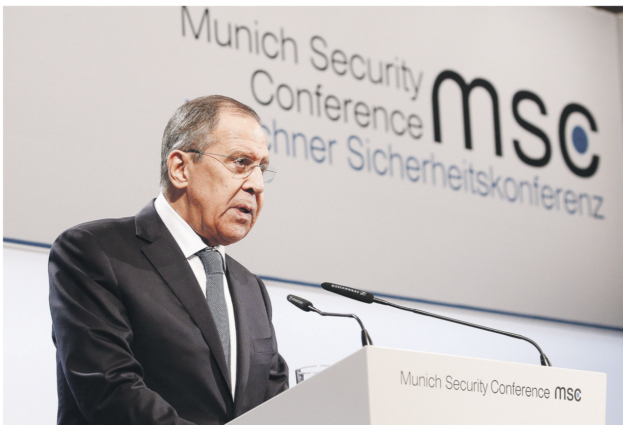
Сергей Лавров заявил, что Россия готова к совместному поиску выхода из глобального кризиса

На ежегодной конференции по безопасности в Мюнхене Сергей Лавров призвал Евросоюз к сбалансированным отношениям с Россией