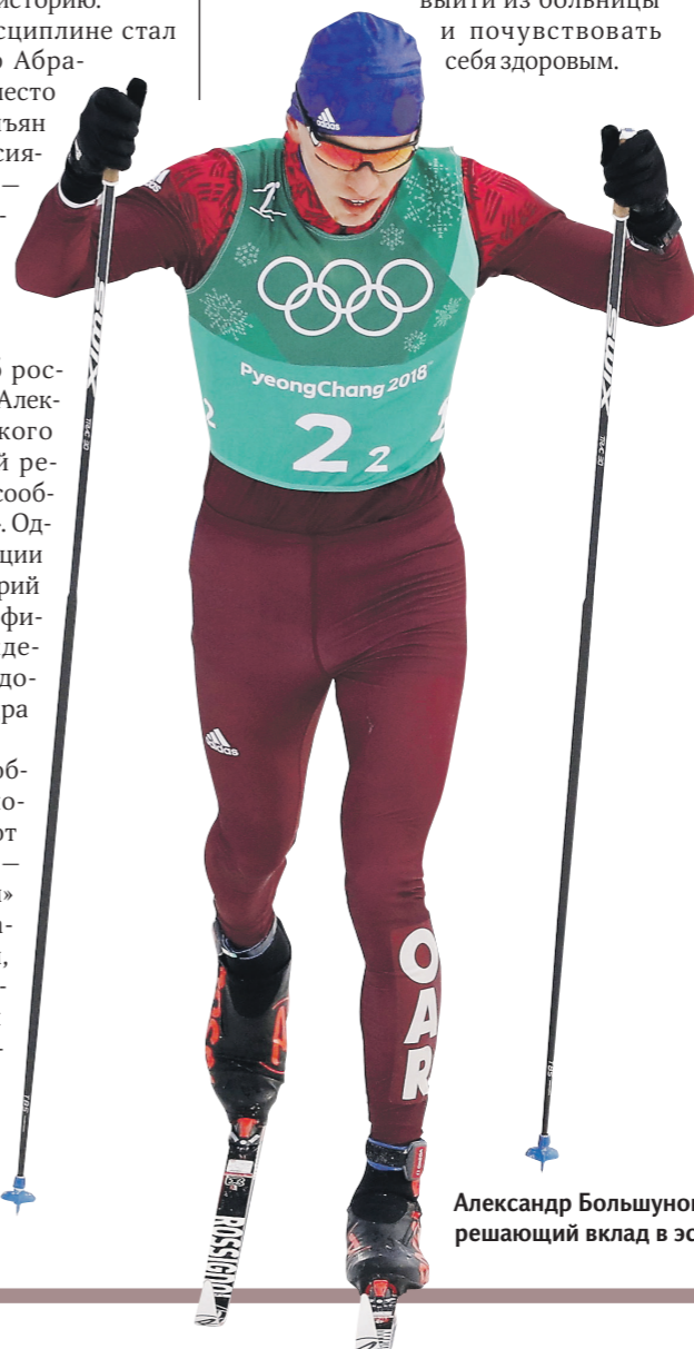
Александр Большунов выиграл бронзу в спринте и внес решающий вклад в эстафетное серебро

Нет. Мне просто хотелось побыстрее выйти из больницы и почувствовать себя здоровым.