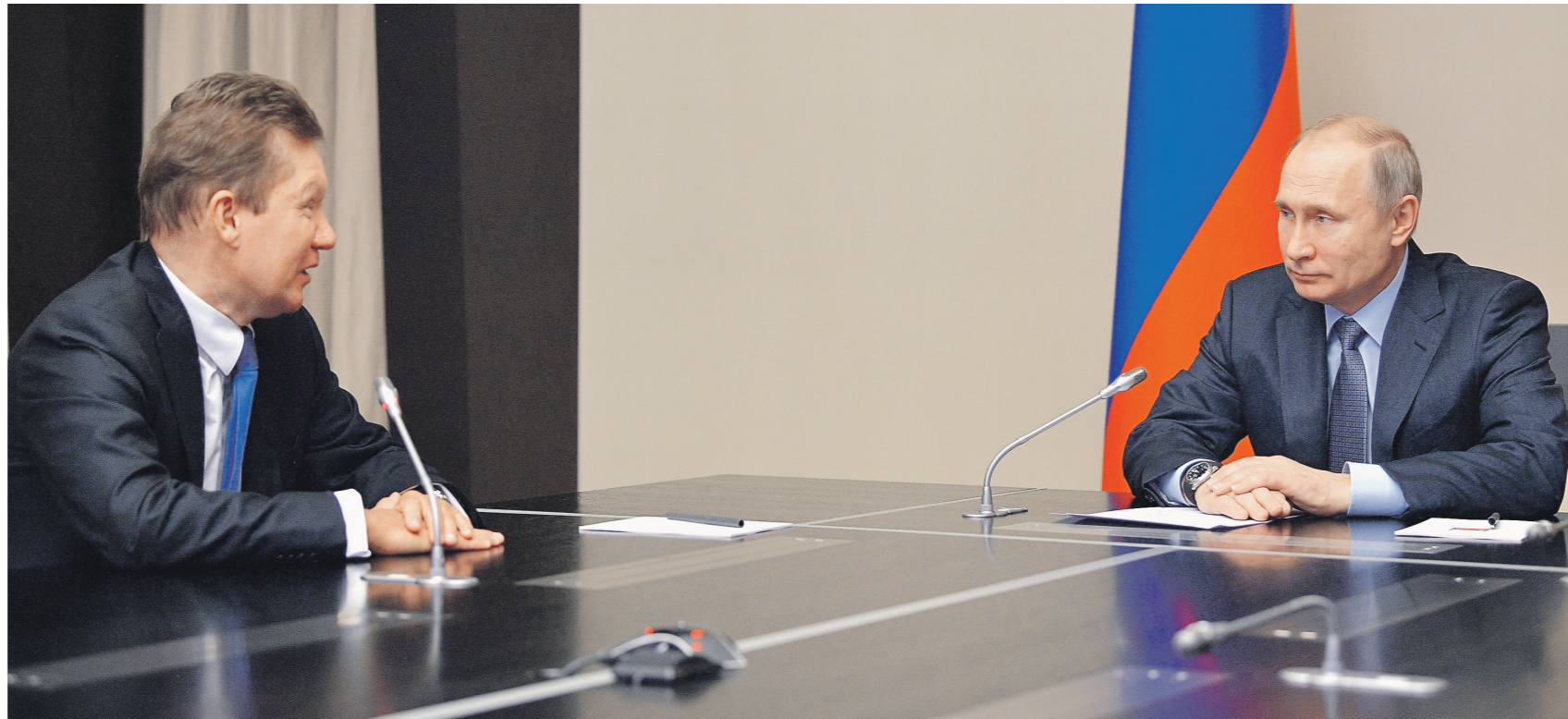
Алексей Миллер доложил Владимиру Путину, что за последние три года экспорт газа увеличился почти на треть

Чтобы удовлетворить растущий спрос на трубопроводный газ из РФ, компания реализует несколько экспортно ориентированных проектов, таких как «Турецкий поток» и «Северный поток-2», отметил он. Одновременно в рамках Восточной газовой программы создается экспортная инфраструктура, которая позволит поставлять топливо на азиатские рынки.