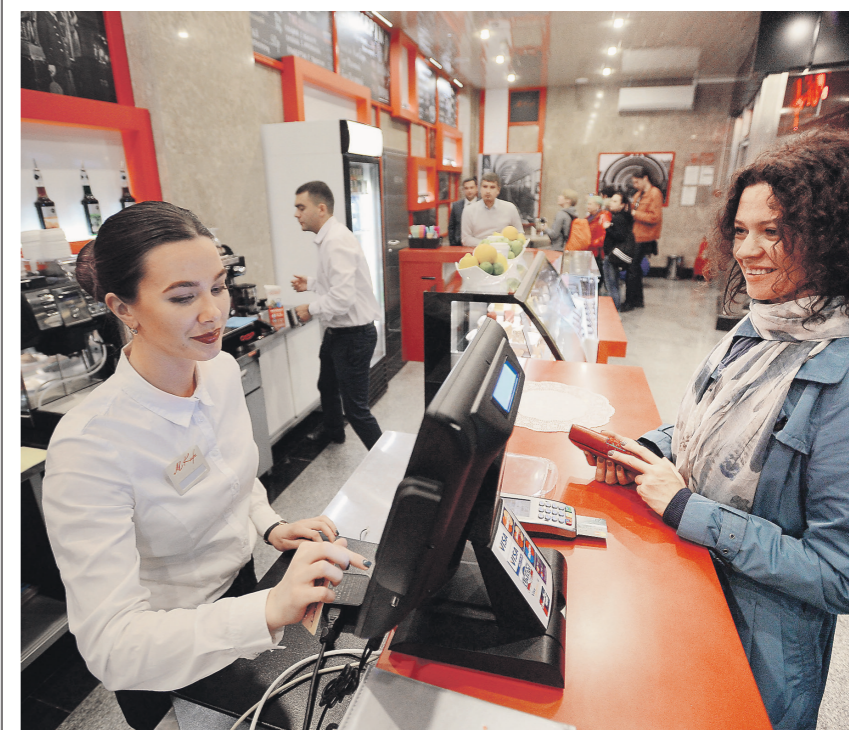
Повсеместное использование онлайн-касс приведет к дальнейшему росту собираемости налогов

Мнение автора может не совпадать с позицией редакции