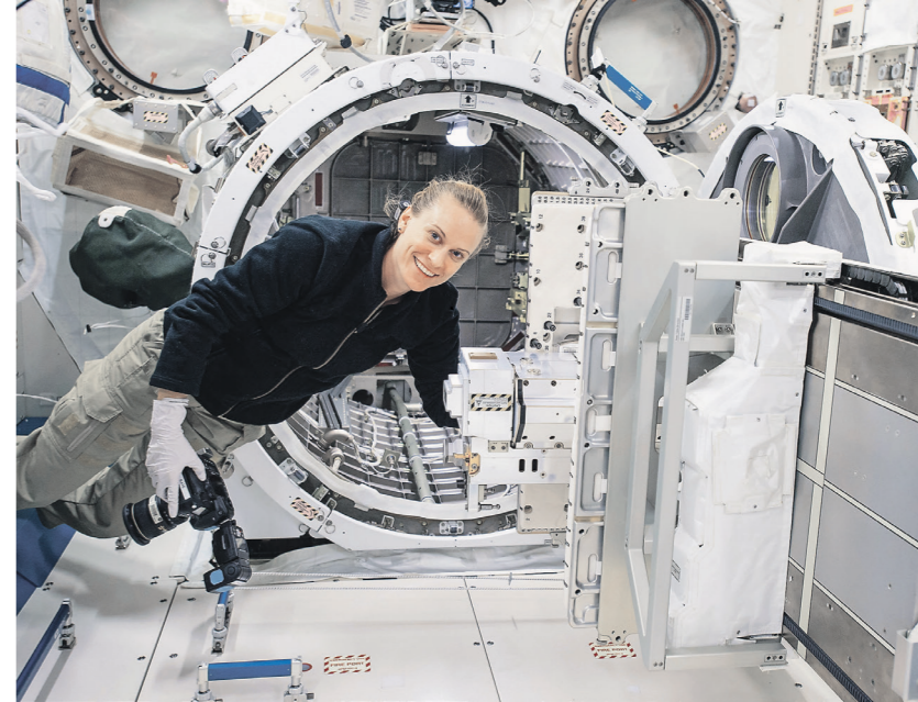
Все грузы на МКС оснастят радиометками

С каждым грузовым кораблем на МКС прибывает значительное количество предметов. Список оборудования, хранящегося в российском сегменте, насчитывает 7 тыс. позиций. Сейчас все объекты на МКС, в том числе в американском сегменте станции, инвентаризуют с помощью приклеенных к ним штрихкодов. Космонавты при разгрузке транспортных кораблей «Прогресс» вручную считывают эти коды и с помощью ноутбуков отмечают места хранения в базе данных. Эта работа отнимает у экипажа много времени.