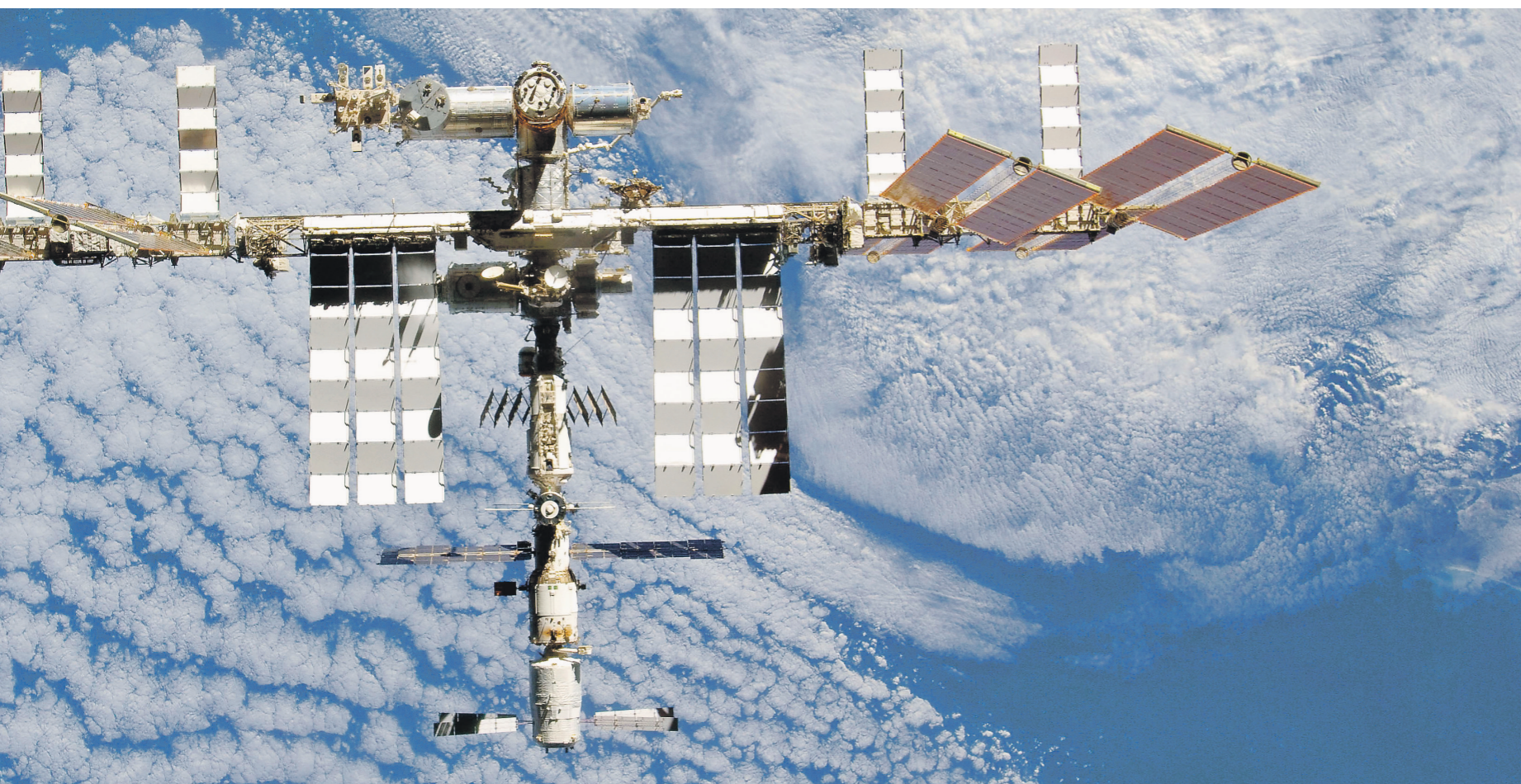
МКС в октябре 2018 года

менены наши новые трубные стали. Общий вес платформы составляет 106 тыс. т (настоящий монстр!), из них 76 тыс. т конструкций из созданных нами абсолютно новых материалов. Даже норвежцы для строительства трех платформ Moss Maritime заказали на ПО «Севмаш» нашу сталь, что подтверждает ее высокую конкурентоспособность на мировом рынке.