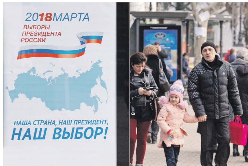
Российские власти уверяют, что попытки сорвать выборы в Крыму не увенчаются успехом

Постоянный представитель Республики Крым при президенте России Георгий Мурадов заверил «Известиям»,