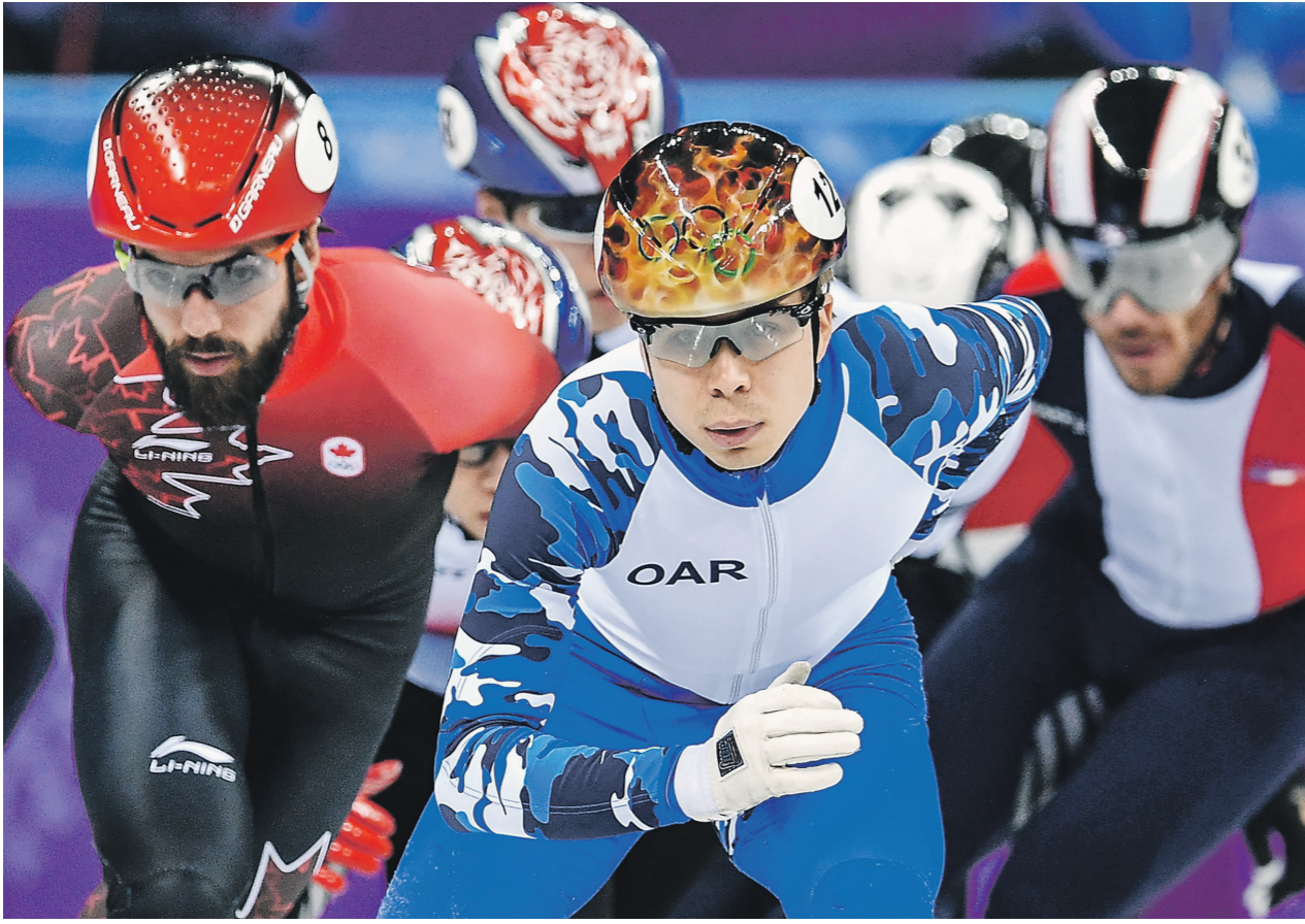
Семен Елистратов (в центре) выступил еще в двух дисциплинах — 500 и 1000 метров

Шорт-трекист Семен Елистратов завоевал первую для россиян награду на Олимпиаде