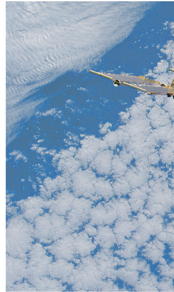
Первая «умная полка» будет доставлена на борт

Как сообщали «Известия», в рамках создания на МКС единой информационно-вычислительной базы РКК «Энергия» объединит в сеть всю имеющуюся на станции компьютерную технику. Устройства в одном отсеке смогут брать на себя решение задач при проведении экспериментов в другом.