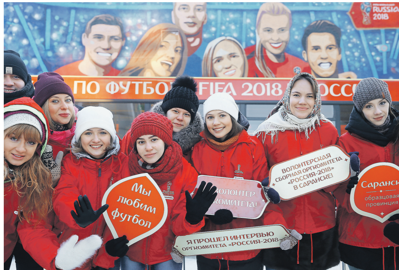
Все волонтеры ЧМ-2018 пройдут вакцинацию в соответствии с национальным календарем прививок

Роспотребнадзор намерен к весне принять новые санитарные правила для массовых мероприятий