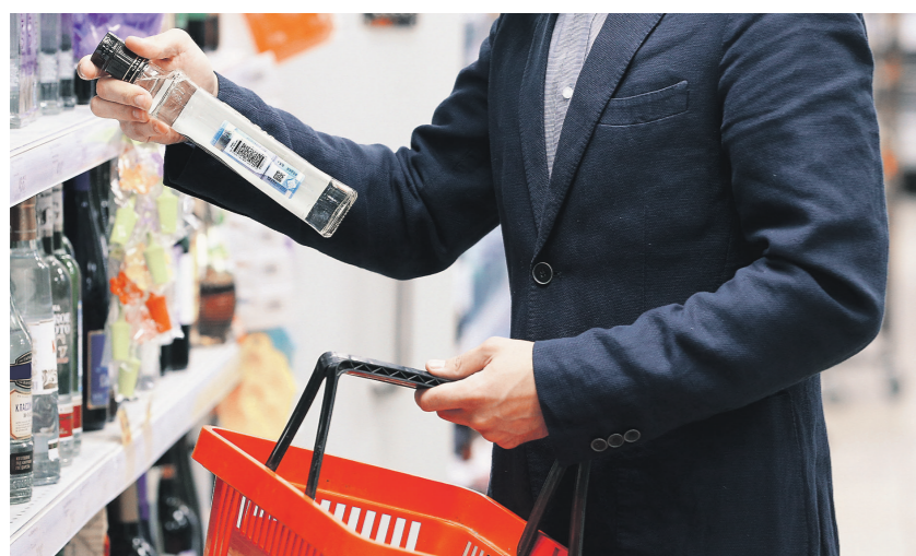
Незаконная водка все реже встречается на полках магазинов