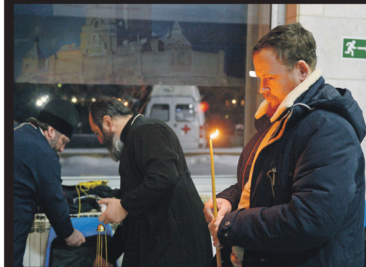
В аэропорт Орска приехали родные и близкие погибших | ТАСС

МНОГИЕ ИЗ НАС ЛЕТАЛИ В МОСКВУ И ИЗ МОСКВЫ НА ЭТОМ САМОЛЕТЕ. И СЕЙЧАС НА САЙТЕ ОРСКА ОЧЕНЬ МНОГО КОММЕНТАРИЕВ ПО ПОВОДУ ЕГО НЕВАЖНОГО ТЕХНИЧЕСКОГО СОСТОЯНИЯ. ДЛЯ ГОРОДА ЭТА КАТАСТРОФА — ОЧЕНЬ СЕРЬЕЗНОЕ ИСПЫТАНИЕ