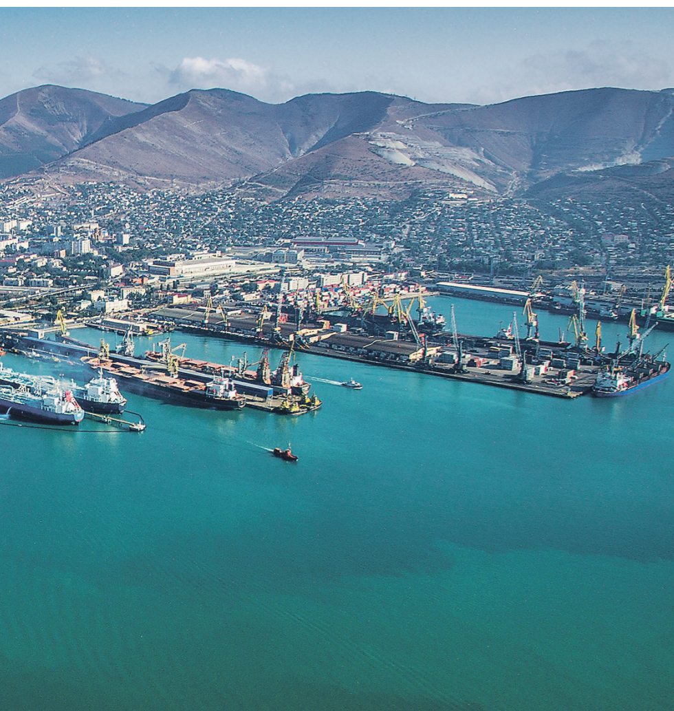
Новороссийский морской торговый порт стоит в плане приватизации на ближайшие три года

будет сокращаться на 10% в течение шести лет