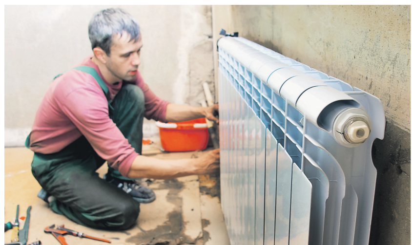
Устанавливая терморегуляторы, собственники квартир могут сократить общее потребление тепловой энергии дома