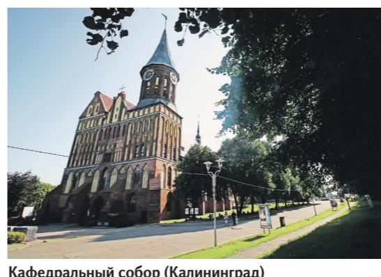
Кафедральный собор (Калининград)