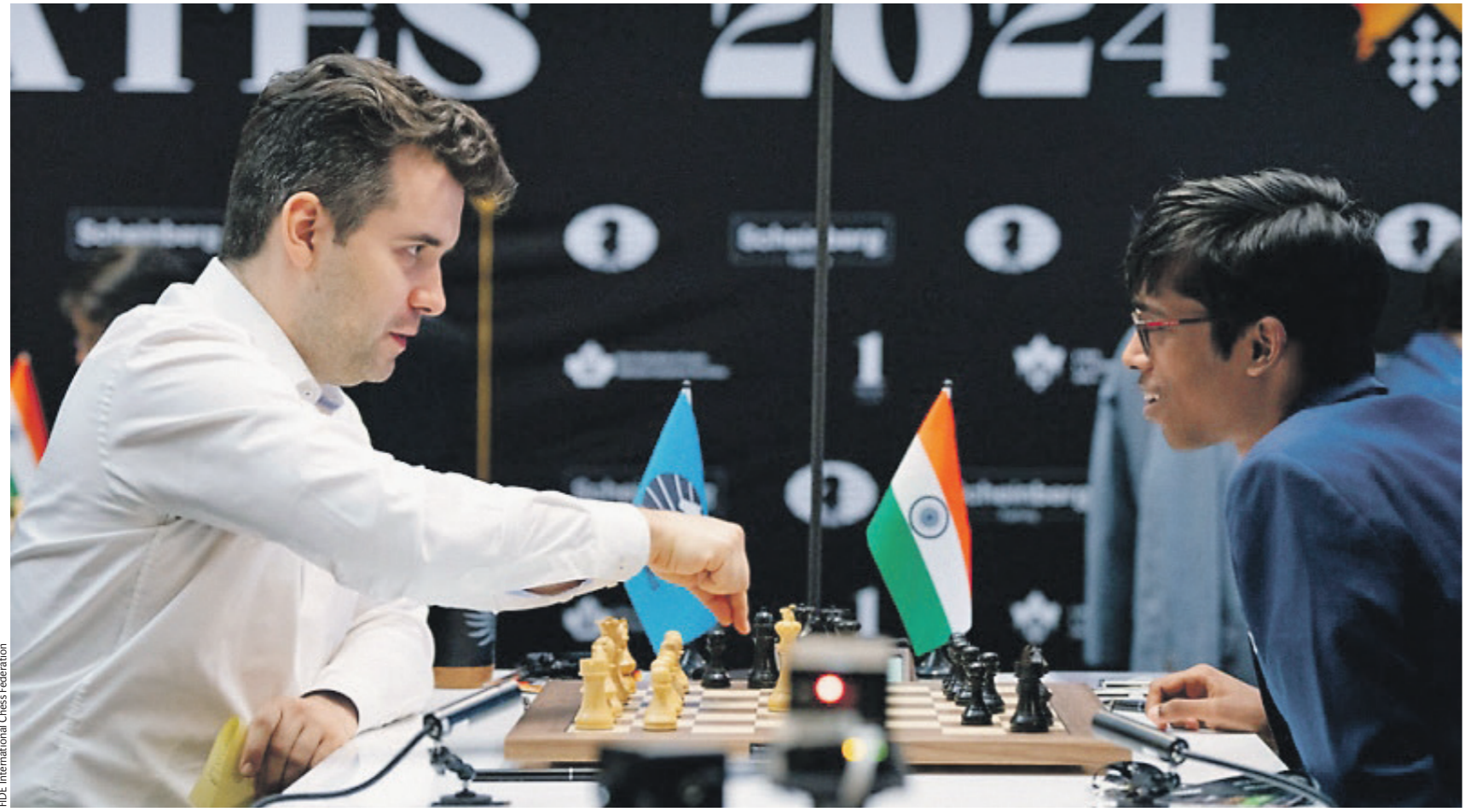
Ян Непомнящий — единственный, кто не проиграл в Торонто ни одной партии