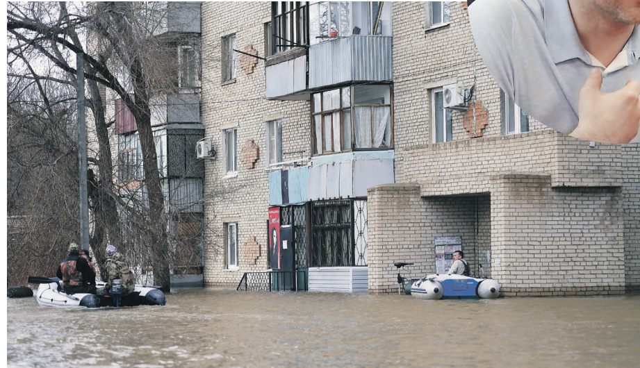
Павел Волков / Иллюстрация

ли, а потом всё разговорили, — ворчит мужчина. — Говорят, дамбу построили очень коряво, а выделенные на неё бюджетные средства тратили не по делу. Тем не менее, вспоминает он, даже когда защитной дамбы не было, в городе были лишь незначительные подтопления. — Пятьдесят лет тут живу, в первый раз такое, что весь город накрыло, — сетует Александр. С ним согласна и другая жительница Орска Мария. — Я живу в этом районе 53 года, такого ещё не видела, — пожаловалась она. — Надо всё вовремя делать и качественно. Как эту дамбу делали? Я сама лично сви-