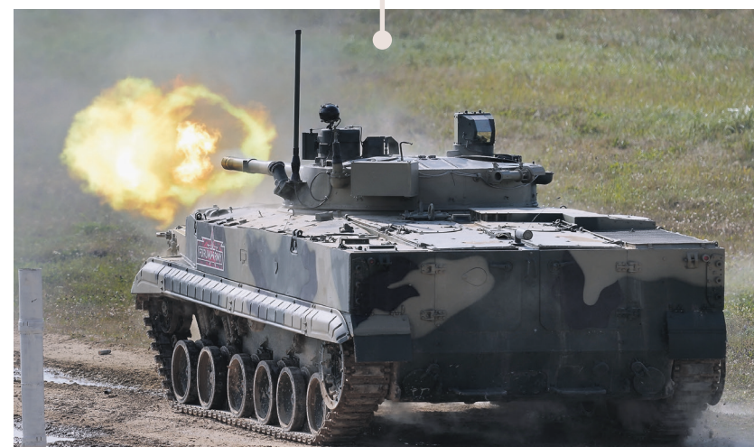
Дмитрий Корнеев / Известия

В советское время помимо воздушных десантных дивизий, подчинявшихся командованию ВДВ, существовали также десантно-штурмовые бригады, входившие в состав сухопутных войск. Они должны были действовать в полсе наступления мотострелковых и танковых частей. Помимо прочего это позволяло держать десантные подразделения в Группе советских войск