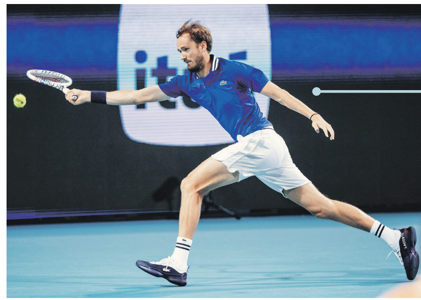
Медведев Д. / Getty Images

В своё время Мария Шарпапова говорила, что чувствует себя на грунтовых кортах как королева на льду, но во вто-