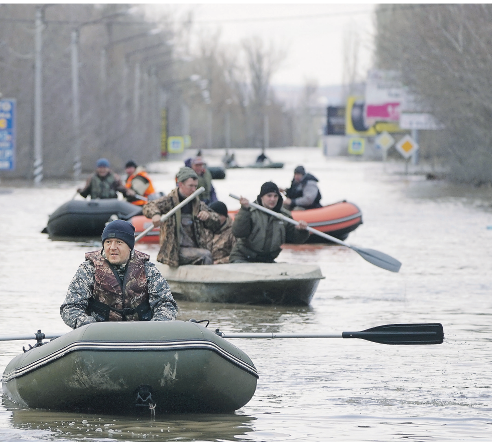
Павел Волков / Иллюстрация

У губернатора Оренбургской области Дениса Паслера вышел оживлённый спор с жителями Орска