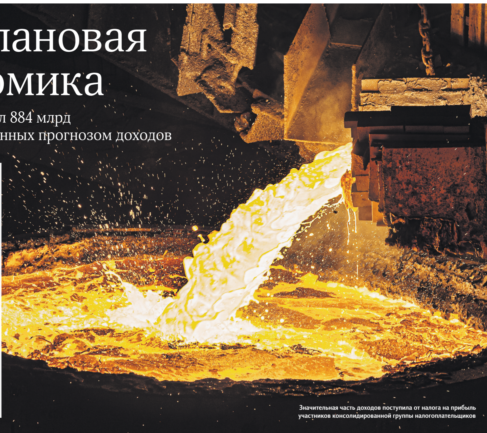
Значительная часть доходов поступила от налога на прибыль участников консолидированной группы налогоплательщиков

За прошлый год в казну поступил 281 вид доходов, не учтённых в прогнозе при формировании финансового плана. Их сумма составила 884 млрд рублей, говорится в мартовском докладе Счётной палаты (СП) об исполнении бюджета в 2023-м (есть у «Известий»). 05 →