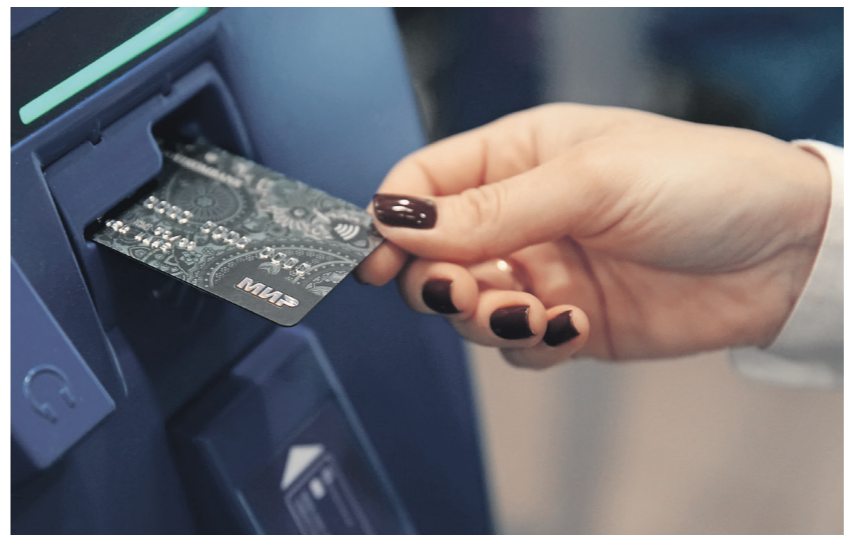
Иван Ефремов / Иллюстрация