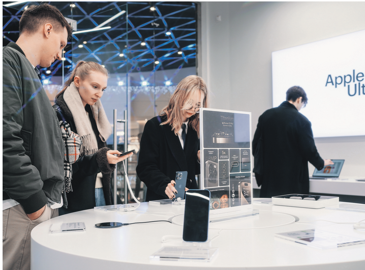
Анна Спирова / Иллюстрация

Apple заподозрили в нарушении антимонопольных норм