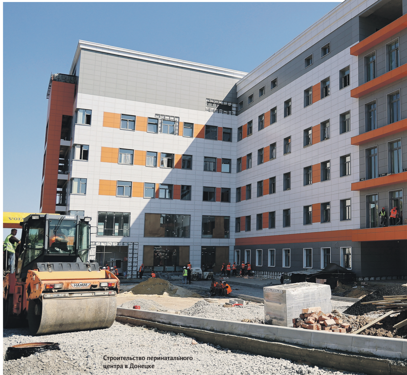
Строительство перинатального центра в Донецке

И действительно, на многочисленных видеозаписях отчётливо слы-