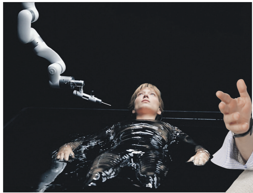
Arte France Cinema

Да, меня пугает. И меня не волнуют забавности в Голливуде и другие подобные вещи. Мне гораздо важнее дети. Как им быть? Что делать, если раньше тебе на философское сочинение для школы надо было потратить три-четыре часа, а теперь три секунды? Что бы вы выбрали на их месте?