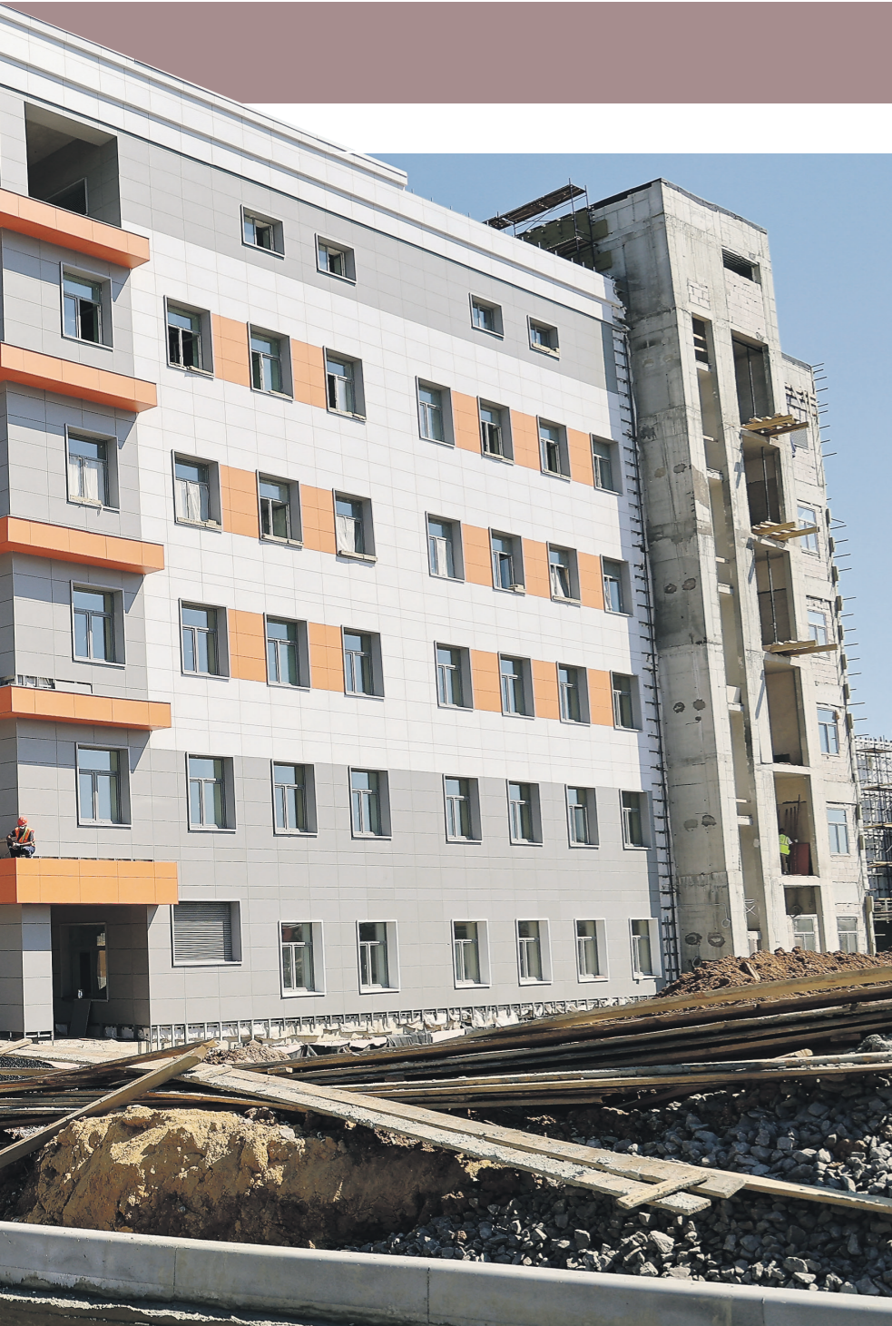
Сергей Астахов / РИА Новости